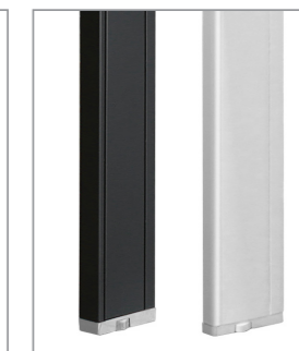
металлические опоры цвета: черный, белый